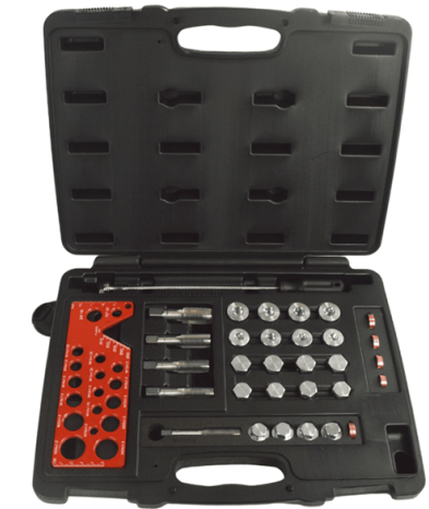
Imagen de referencia sujeta a cambio de diseño