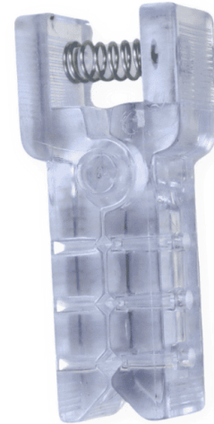
Imagen de referencia sujeta a cambio de diseño

Herramienta ideal para pinchar cables, con esta herramienta puedes sujetar los cables para así realizar pinchazos de una manera segura sin destruir el cable, así puedes realizar pruebas a los cables sin preocuparse de alguna avería al mismo, de esta manera ayuda a mejorar la labor del operario, ayudando a ahorrar tiempo en el proceso, de igual manera puedes mejorar tu productividad realizando procesos en menos tiempo y aumentar tus ingresos.