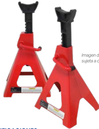
Imagen de referencia sujeta a cambio de diseño