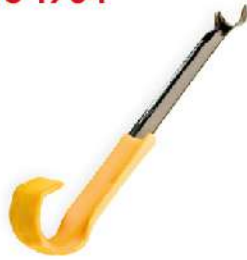
Extractor de Cables de Bujías 405-1904