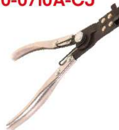
Pinza para Anillos 210-0710A-CJ