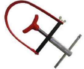
Bloqueador para volantes de motos 70 mm-125 mm 096-7005