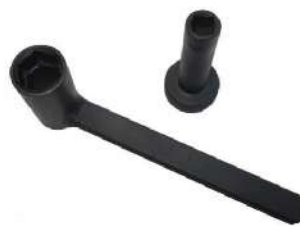
KIT AJUSTE DE VALVULAS 318-0391