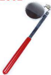
Espejo Telescopio 209-2002