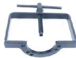
Herramienta para el muelle del embrague. 155 mm para motores de 50-250 cc con polea de 125-155 mm 096-7047