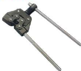
ROLLER CHAIN DETACHER KA-3366