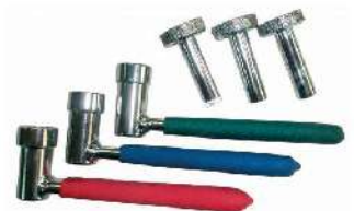
Herramientas para Ajustar valvulas de motos. 318-0321