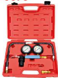
Medidor Fugas de Compresión Doble Manómetro 789-0090