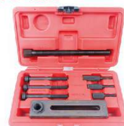
Separador de carcasas para motocicleta 096-4251