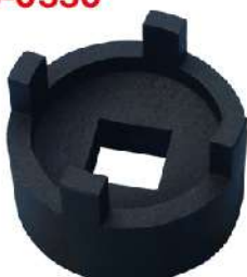
Llave de embrague y filtro de aceite para honda 318-0330