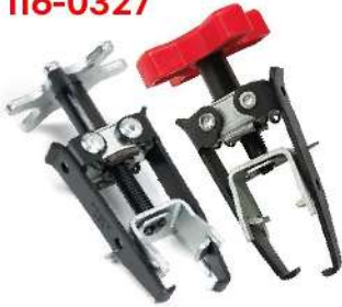
Compresor de Resortes de Válvulas 116-0327