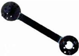
Extractor rotor HI-FF0527