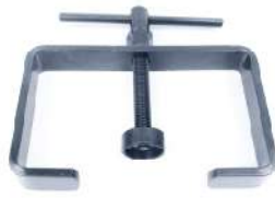
Herramienta para el muelle del embrague de 155 mm para motores de 125-250cc con polea de 130-155 mm. 096-7046