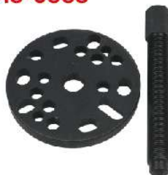
Extractor de embrague y alternador para motos 318-0338