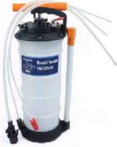
Extractor de Fluidos Manual de 4 Litros 066-0148