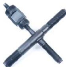
Extractor de volantes 4 servicios 096-7003