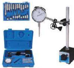
Indicador de Esfera con Soporte de Base Magnética OP-6567