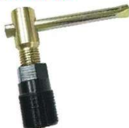
Extractor de iman para volantes de motos 038-MF03