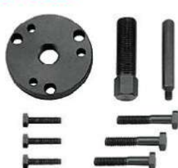
Extractor de volante para moto 318-0333