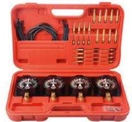
Kit Herr de Medidores y Sincronizador de Carburado B100132