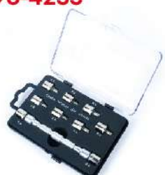
Set herramienta para radios de de las llantas 096-4255