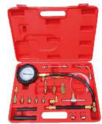
Kit de Medición de Presión de Combustible HS-A0020