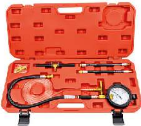
Kit de Medición de Presión de Combustible 789-0065