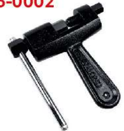
Extractor de pines de cadenas cortador de cadenas 766-0002