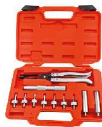
Extractor e Instalador de Sellos de Válvulas 741-0246C