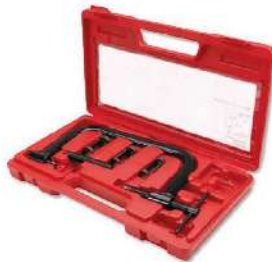
Compresor de Resorte de Válvulas Básico 096-7002