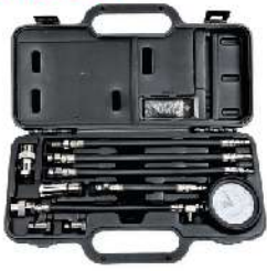
Kit de Compresímetro con Adaptadores HI-EJ1901