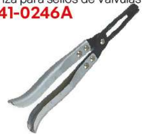
Pinza para sellos de Válvulas 741-0246A