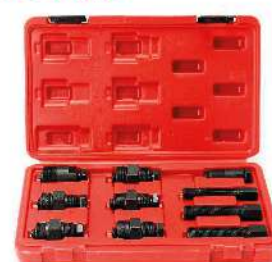
Set extractor de volantes 096-7013