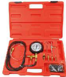
Kit Medición de Presión Combustible MPI 647-1021B