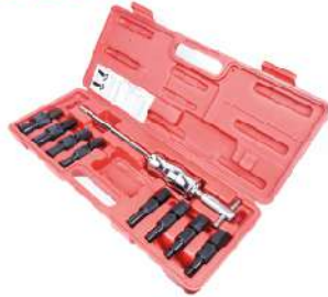
Extractor de Rodamientos 096-7009