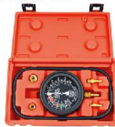
Vacuometro Profesional con Adaptadores 789-0085A