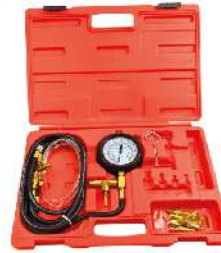
Kit Medición de Presión Combustible Básico 647-1021A