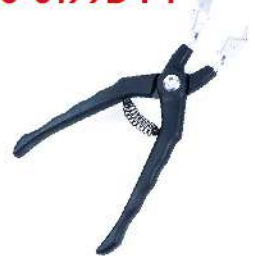
Pinza Tipo Relay A 90° 210-0199B-FT