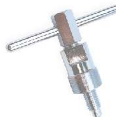
Extractor magneto de volante 318-0323