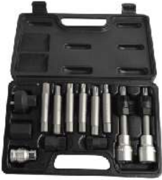
Set de Puntas Torx para Servicio de Alternador 002-9112