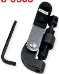
Extractor de pasador cadena motos 318-0306