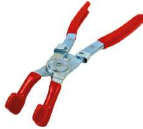
Pinza para Extraer Capuchones de Bujías 210-0390A-CJ