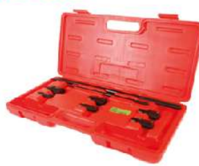
Set para Remove Rodamientos de Moto 318-0368