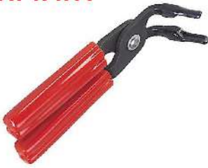
Pinzas para extraer e Instalar Relé HI-1917A