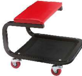
Silla para Mecánico con Bandeja HS-SS02