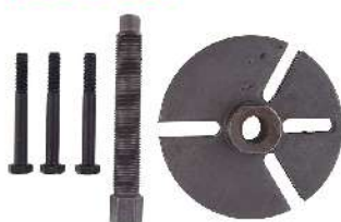
Herramienta de extracción de volante para moto 766-0408