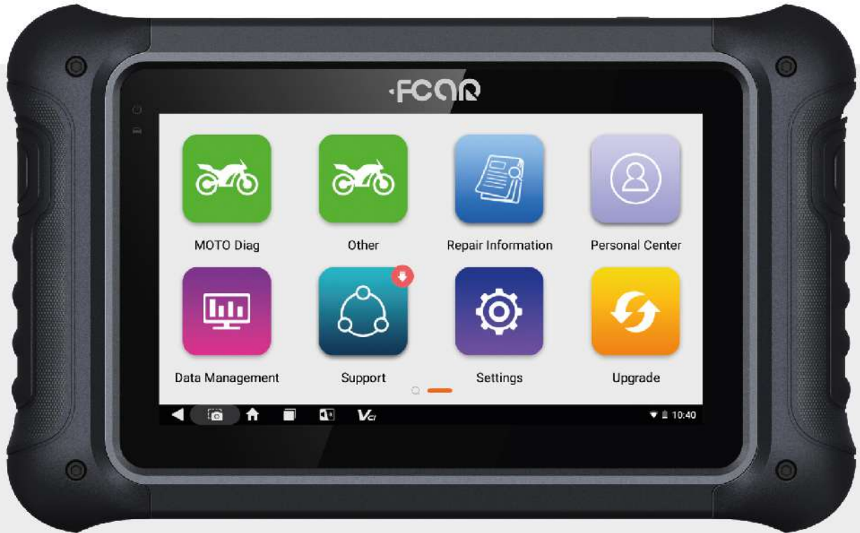
*Imagen de referencia sujeta a cambio de diseño