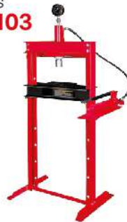
Prensa Hidráulica de 10 Toneladas ZD-07103