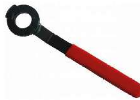
Herramienta para tuercas especiales moto HI-GK2906