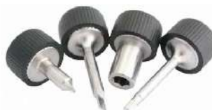
Herramienta para servicio de carburadores 318-0366B