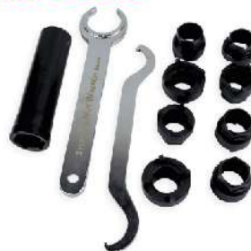
Set de tuercas de direccion 766-0005S